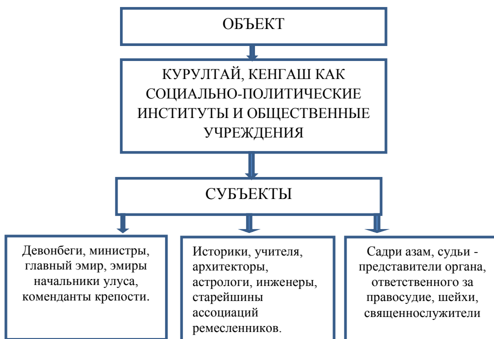
Рисунок 1: Механизмы функционирования государственной администрации Амира Темура

мерами» 23 . Анализ показывает, что Амир Темур координировал отношения между государством и обществом через консультативные органы. Известно, что еще до XIV века на территории древнего Турана существовали великие царства 24 , прославившие мир, но они не были такими централизованными, как во времена Сахибкирана. В государстве Амира Темура законы работали строго. Именно поэтому государство, основанное Амиром Темуром, сильно отличается от своих предшественников. (Рисунок 1)