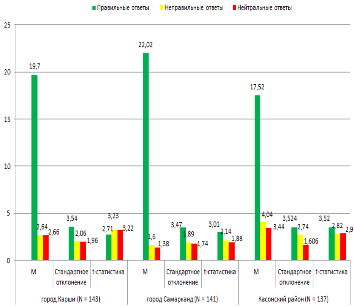
Рисунок -1 Результаты (по t- критерию Стьюдента) опросника «Установление коммуникативного общения с ребенком и определение уровня произвольного поведения» (по Л. Красильниковой).

этапы осуществления психодиагностических целей, общий обзор используемых методов при исследовании. А также, в исследованиях учёных обращаются внимания психологическим аспектам коммуникативных возможностей, определяющим коммуникативную способность детей дошкольного возраста, на связь между факторами произвольного поведения и на качества процесса семейных отношений.