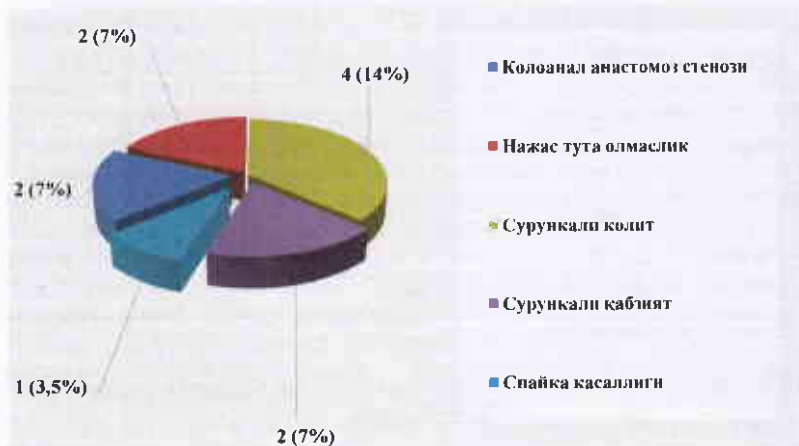
1 расм. Соаве модификацияси бўйича ҚОПДдан кейин кечки асоратлар

Назорат гуруҳида хирургик даволашнинг кечки натижалари 27 нафар (84%) беморда катамнестик қабул вақтида сўровнома, беморни бевосита ва электрон мулоқот, болалар ота-онаси томонидан анкета тўлдириш йўллари билан ўрганилди. Назорат гуруҳининг 10 (37%) нафар болада жуда яхши натижа қайд этилди. 6 нафар (22%) болада яхши натижа қайд этилди, 7 нафарида (26%) – қониқарли натижа, қониқарсиз натижа эса 4 нафар (15%) беморда қайд этилди (1 расм).