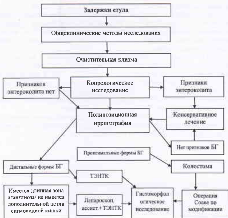
Рис.3. Алгоритм диагностики и лечения новорожденных и грудных детей с БГ.