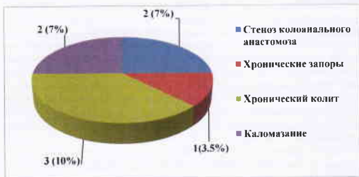
Рис. 2. Поздние осложнения у больных основной группы после ТЭНТК.

Отдалённые результаты хирургического лечения изучены у 29 (85%) больных. Отличные результаты получены у 13 (45%), хорошие результаты получены у 8 (27.5%), удовлетворительные – у 5 (17%) и неудовлетворительные у 3 (10%) больных. Несмотря на преимущества ТЭНТК перед БППП, у 23% больных основной группы возникли поздние осложнения (рис. 2).