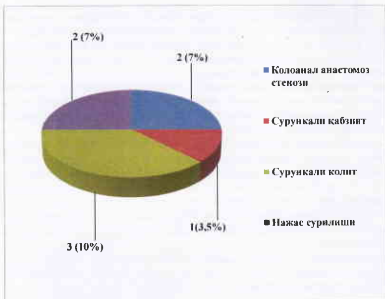
2 расм. Асосий гуруҳ беморларда кечки асоратлар.

14% ҳолатларда колоанал анастомоз ва нажас суркалиши қайд этилди; 4,1 % ҳолатда – сурункали колит. Барча асоратлар мақбул реабилитацион тадбирлар ёрдамида бартараф этилди (физиотерапия, ДФК, электростимуляция, БОС терапия).