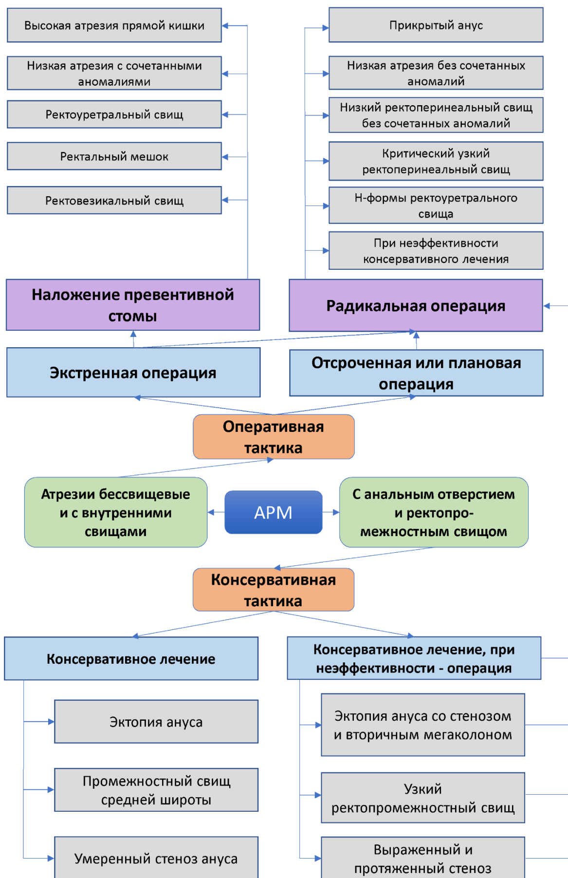
Рис.2. Алгоритм лечебной тактики при АРМ у мальчиков