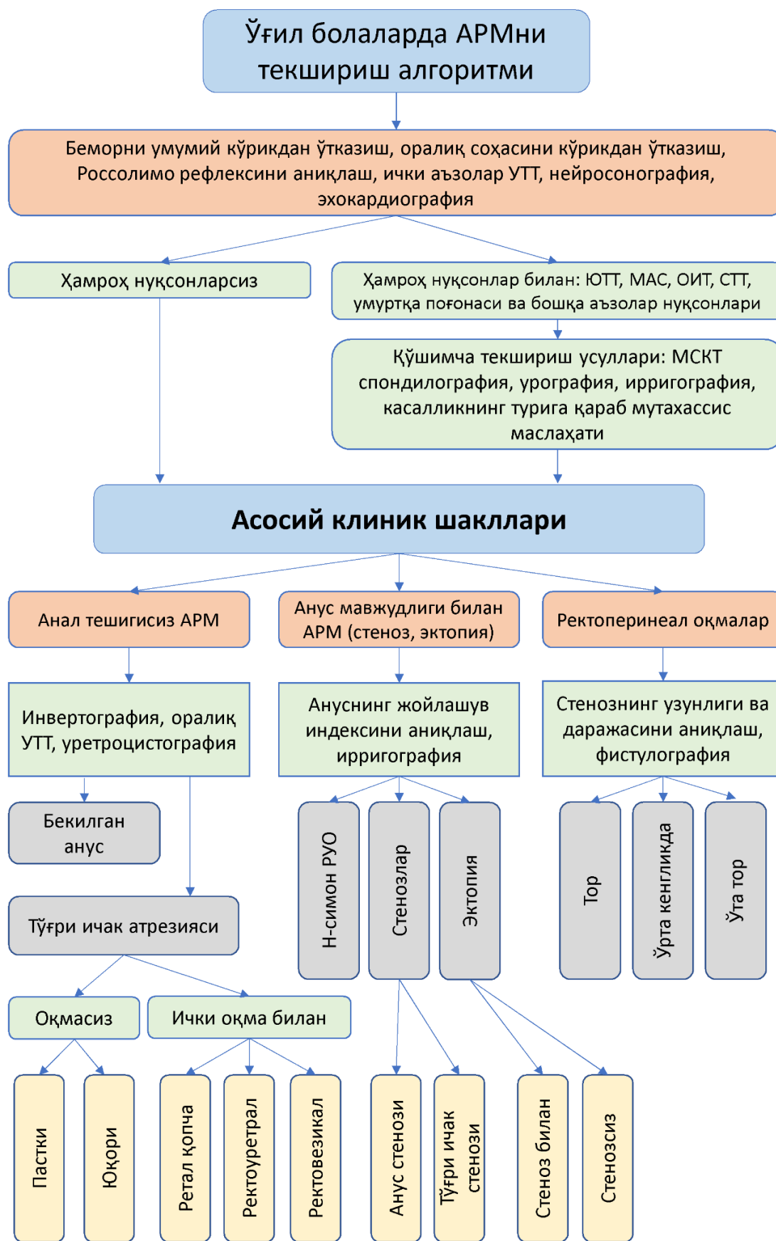
1-расм. Ўғил болаларда АРМни анатомик шакллари аниқлаш ва ташхислаш алгоритми