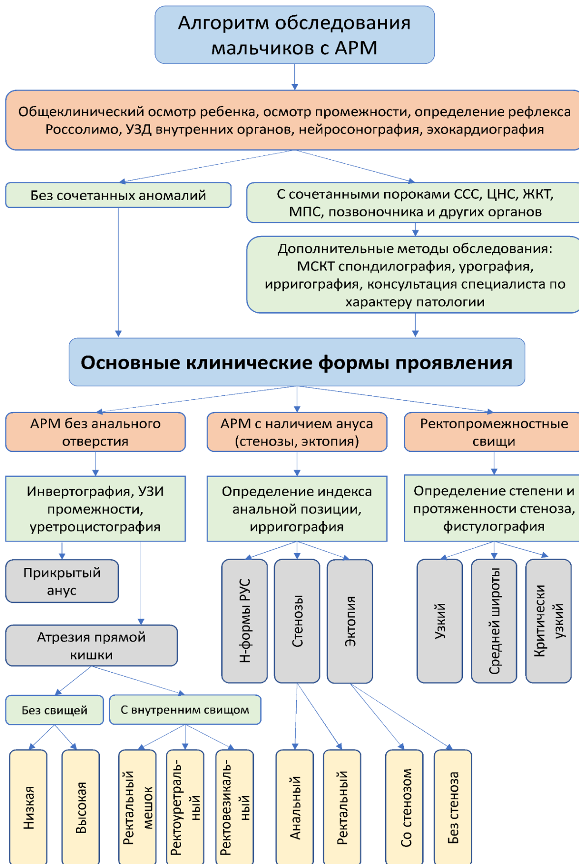
Рис.1. Алгоритм диагностики по верификации анатомических вариаций АРМ у мальчиков