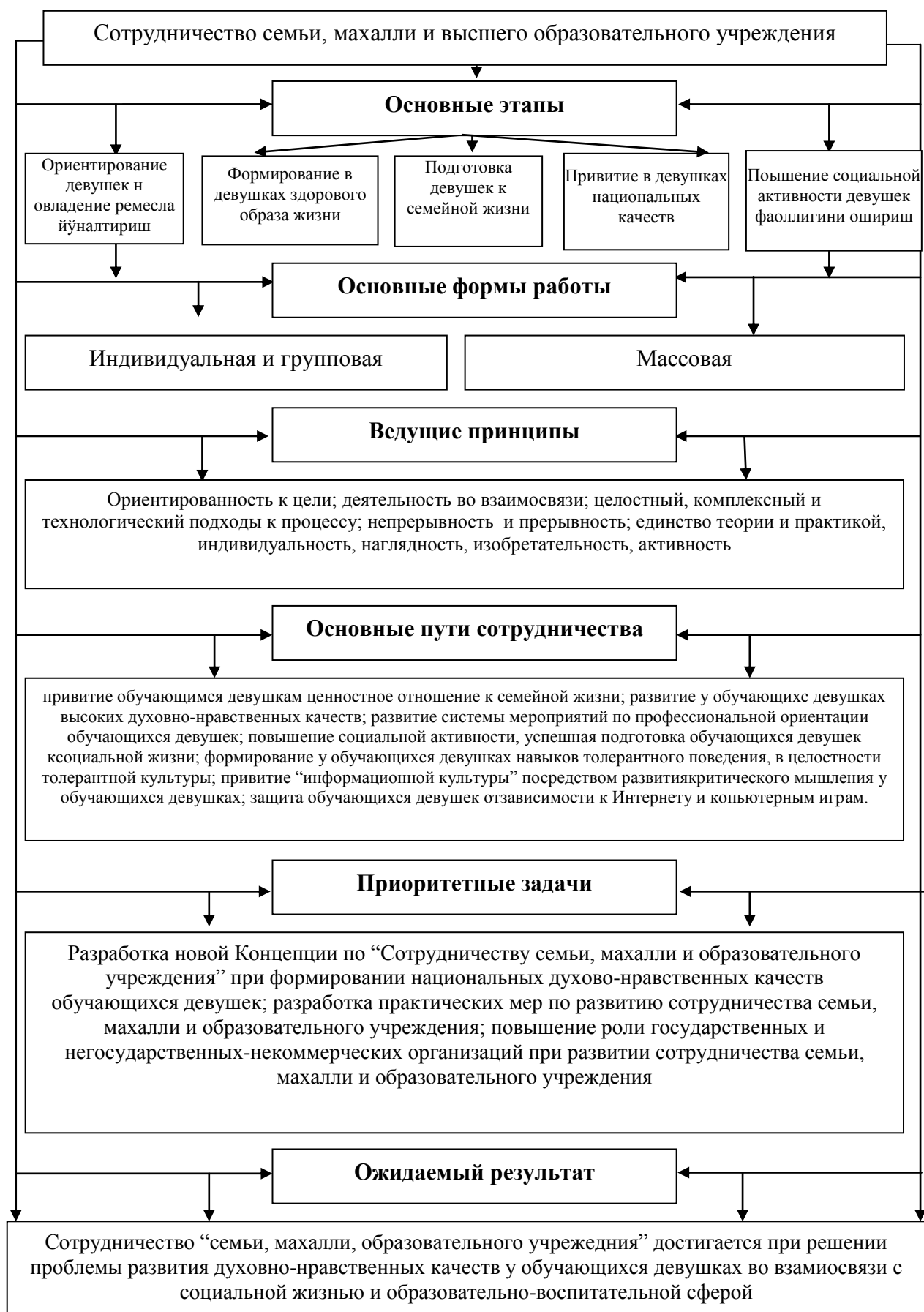
Рисунок 1. Модель развития национальных духовно-нравственных качеств обучающихся девушек