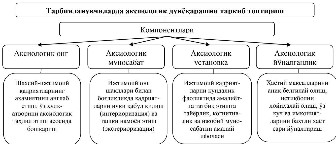
1-расм. Меҳрибонлик уйлари тарбияланувчиларида аксиологик дунёқарашни таркиб топтириш тизими

Мазкур омилларнинг барчаси ўзаро алоқадор ва боғлиқ бўлиб, Меҳрибонлик уйлари тарбияланувчиларида аксиологик дунёқарашни таркиб топтириш компонентларини такомиллаштиришни талаб этди. Тарбияланувчиларда аксиологик дунёқарашни таркиб топтириш қадриятга йўналтирилган онг, муносабат, установка ва ориентациянинг бирлигини ва алоқадорлигини таъминлашни тақозо этади (1-расм).