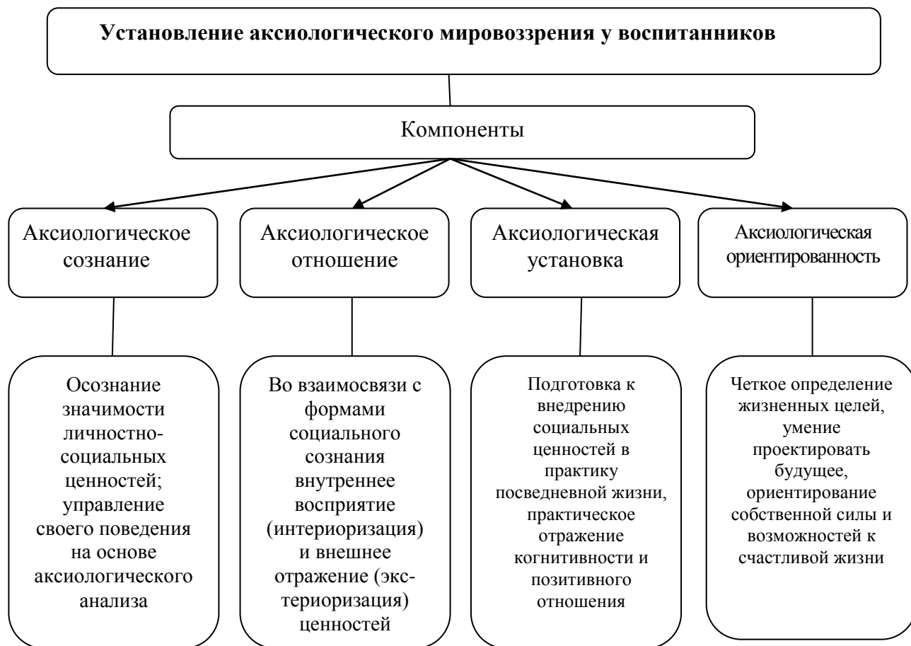
Рисунок № 1. Система установления аксиологического мировоззрения у воспитанников домов “Мехрибонлик”

создание необходимых условий для образа жизни и жизнедеятельности, приравненных в максимальной степени к семейной среде, дающих возможность усвоения образцов полово-ролевого поведения, понимания семейных идеалов и ценностей; развитие отношений между взрослыми и детьми на основе сотрудничества, взаимного уважения и доверия.