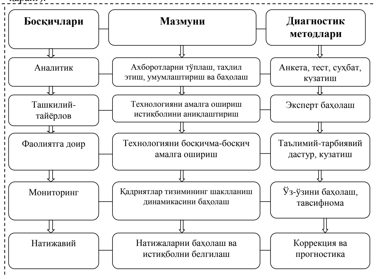
3-расм. Меҳрибонлик уйлари тарбияланувчиларида қадриятлар тизимини шакллантиришнинг локал-модулли технологияси

Технология расм кўринишида қуйидаги кўринишга эга бўлди (3-расмга қаранг).