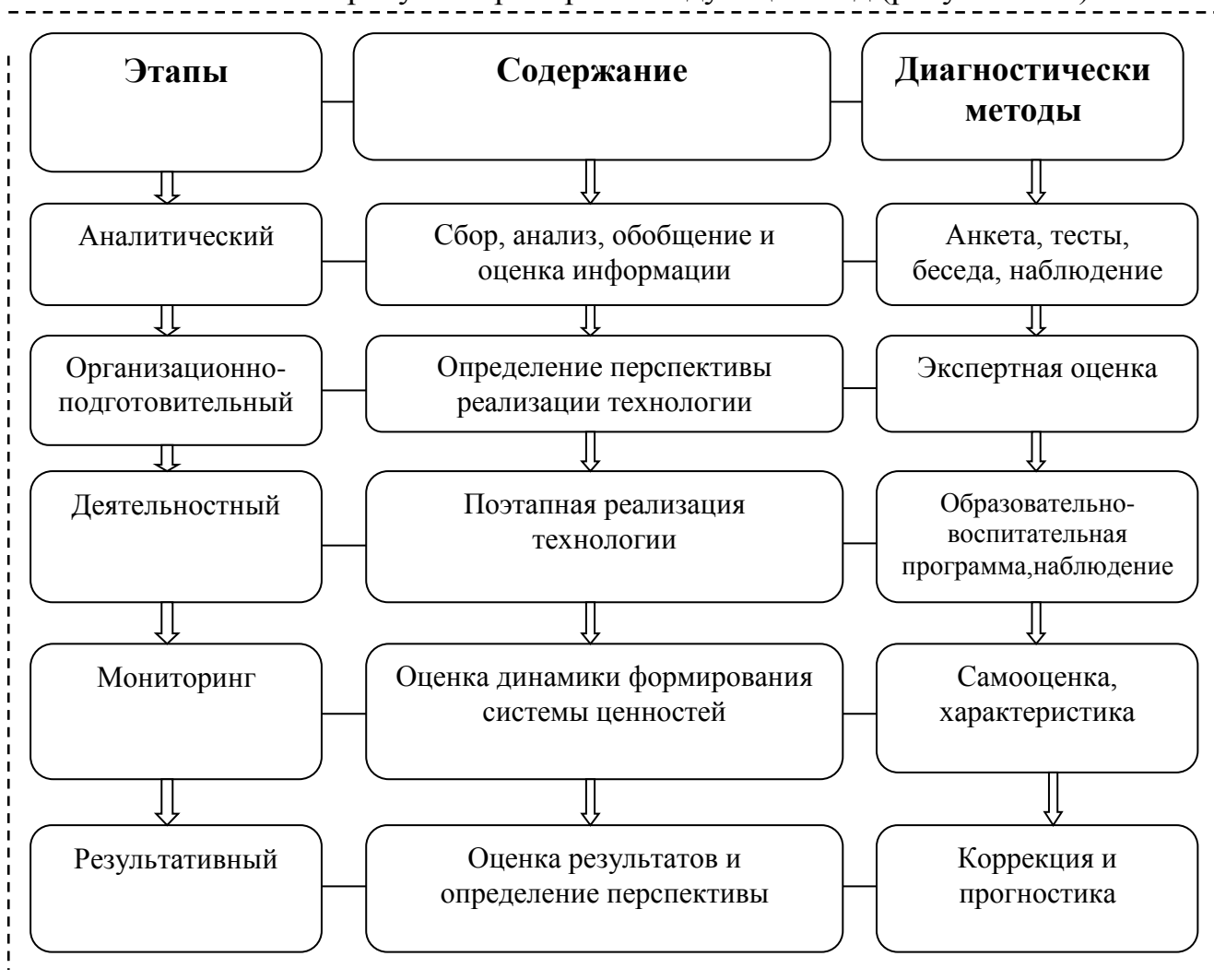
Рисунок № 3. Локально-модульная технология формирования системы ценностей у воспитанников домов «Мехрибонлик»

Технология как рисунок приобрела следующий вид (рисунок № 3).