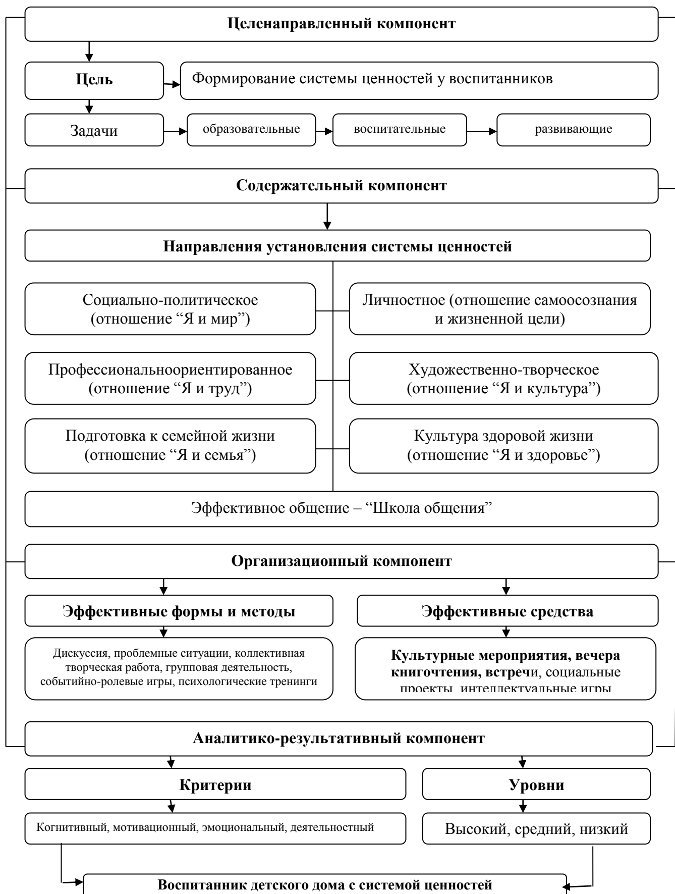
Рисунок № 2. Социально-педагогическая модель формирования системы ценностей у воспитанников домов “Мехрибонлик”