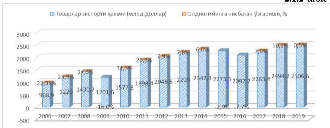
Table was formed by author in accordance with data of UNCTADSTAT.

The main reason for this is due to the fact that China's largest trading partner is also associated with a decrease in the volume of trade in PRC as a result of the financial crisis in the US, but in 2010 this figure sharply increased by 31.3 percent, due to which Chinese tokens occupied new markets (including the markets of Central Asia, Central and South America). But, in 2011-2016, there was another decline in the volume of Chinese goods exports, which was the result of a policy aimed at increasing the value of the Chinese RMB. A similar situation was observed in the dynamics of Chinese export services.