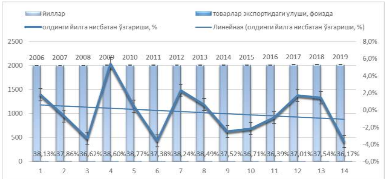
Table was formed by author in accordance with data of UNCTADSTAT.

Analysis of the situation of the export support trend in the PRC indicates that Foreign Trade Balance had a negative balance until the beginning of the 90-ies of XX century. The main reason for this is explained by the fact that in the early stages of reforms, technological imports were the only source of the formation of the national economy.