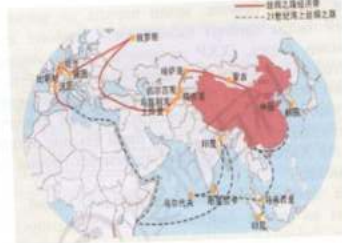
2-расм. “Бир белбоғ бир йўл” харитаси 1

Бундан кўриш мумкинки, “Бир белбоғ бир йўл” барча соҳани қамраб олган. Қуруқликдан Марказий Осиё, Россия, Европа давлатларига, денгиздан эса Жануби-Шарқий Осиё, Хиндистон, Африка давлатларига йўл очилмоқда. Бу ХХР геосиёсий манфаатлари учун чексиз имконият манбаидир.