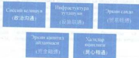
1-расм. “Бир белбоғ бир йўл” бўйича ҳамкорликнинг бешта асосий йўналиши

Мазкур лойиҳа бўйича ҳамкорликнинг бешта асосий йўналиши белгиланган: 4