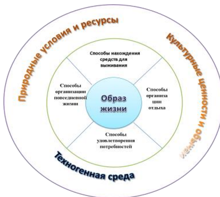
Рисунок 1. Направления деятельности, олицетворяющие образ жизни и основные географические факторы, влияющие на них (составлен автором)

Чтобы в полной мере выразить содержание понятия «образ жизни», необходимо обратить внимание на содержание таких категорий, как «уровень жизни», «качество жизни», «условия жизни». Если образ жизни отражает повседневную деятельность человека, условия жизни отражают состояние среды обитания людей. В свою очередь, уровень жизни означает состояние удовлетворения материальных потребностей людей, а качество жизни предполагает оценку жизни населения в материальном и духовном контексте, определение её соответствия определенным стандартам.