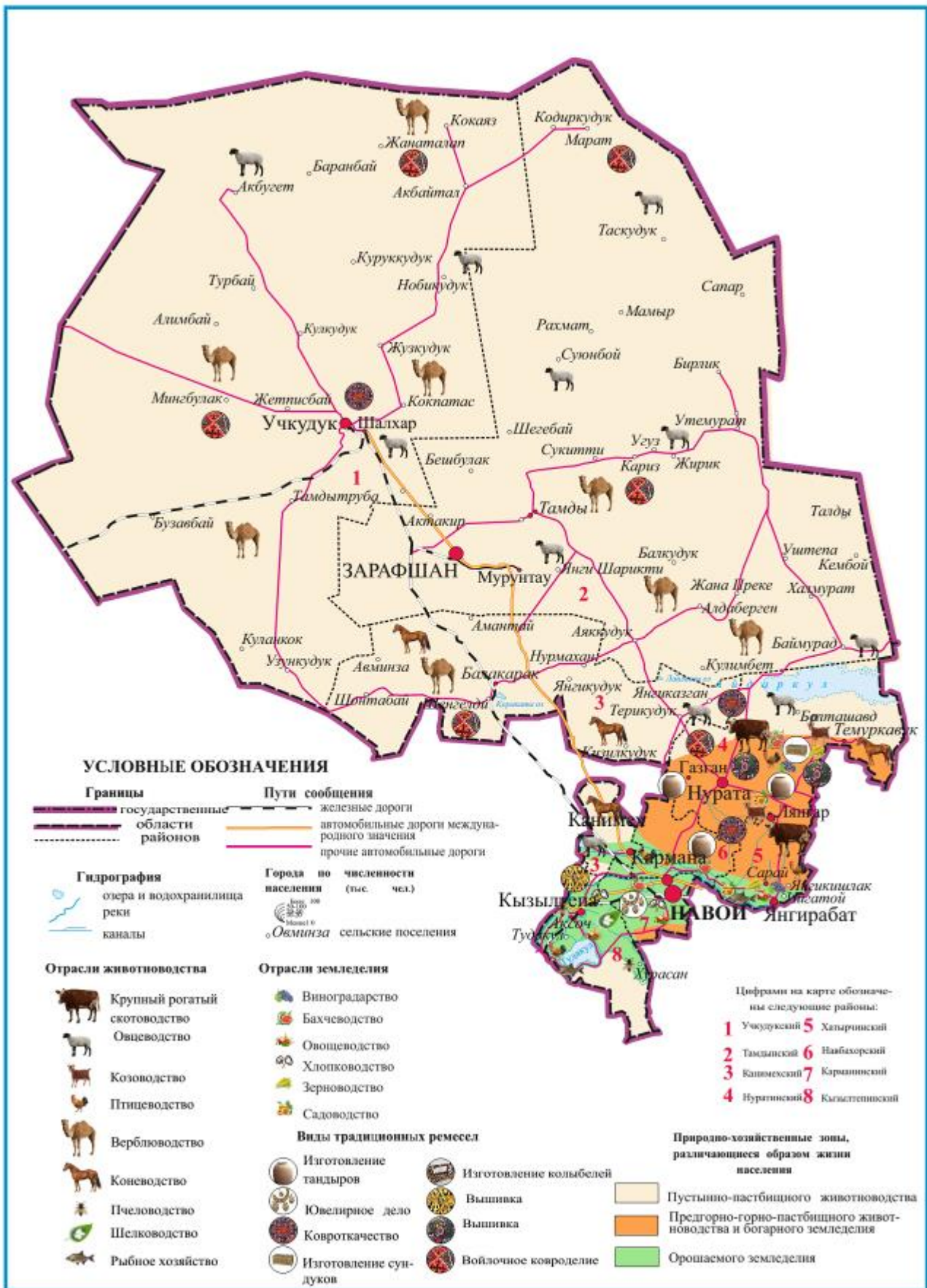
Рисунок 2. Карта природно-хозяйственных зон Навоийской области, различающихся образом жизни населения