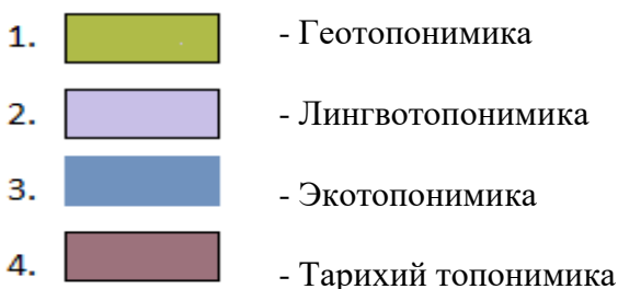
1-расм. Географик номларнинг ижтимоий- экологик хусусиятларини ўрганишда фанлараро алоқадорлик