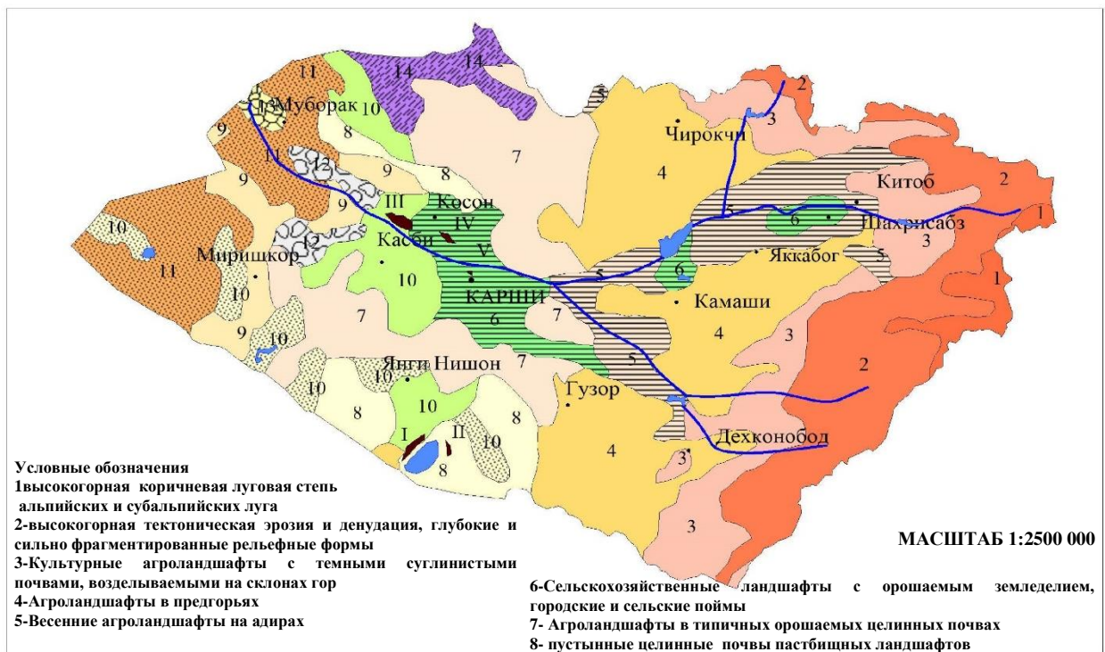
Рис. 1. Карта-схема ландшафтов Кашкадарьинского бассейна