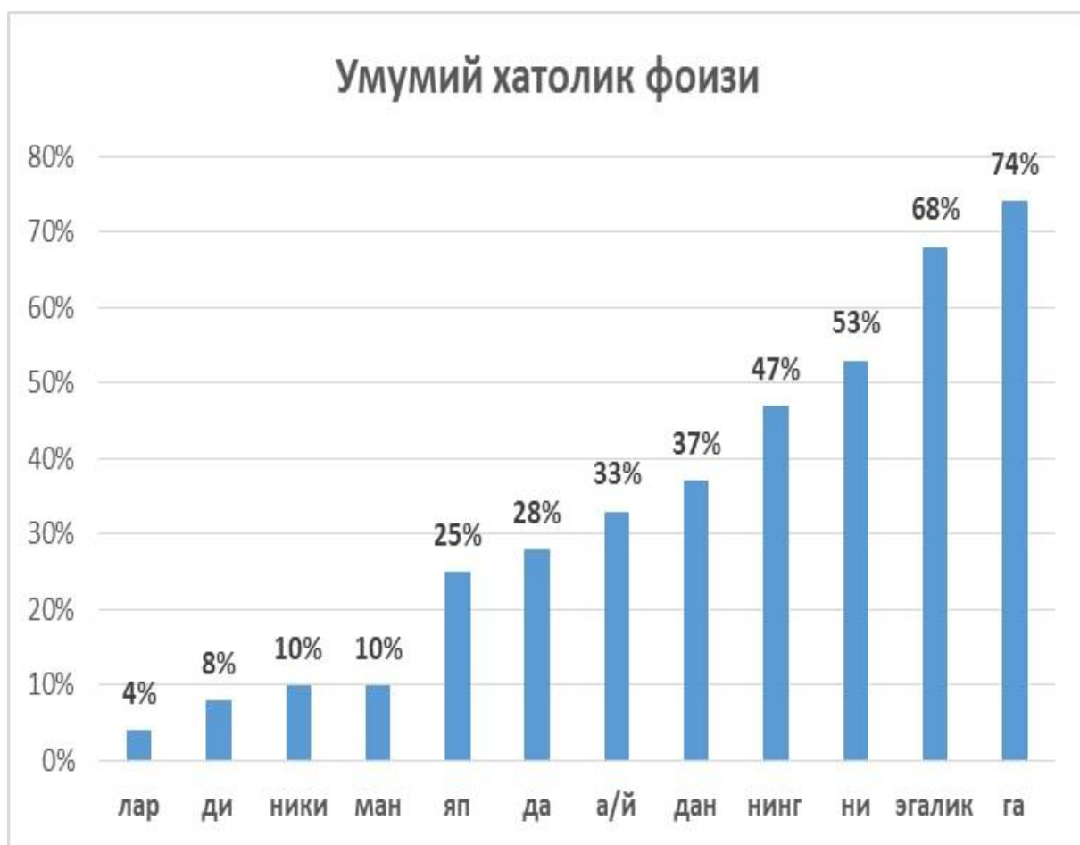
2-чизма. Хитойлик талабалар билан ўтказилган тажриба натижалари (фоиз ҳисобида)

Натижага кўра, -лар кўплик шаклидан деярли барча ўринда тўғри фойдаланилган. Таҳлилда бир замон қўшимчаси ўрнида бошқа замон шаклининг алмаштириб қўлланилиш ҳолати, лекин бирор ўринда уларнинг туширилмагани кузатилди. Келишикларни бир-бирининг ўрнида нотўғри қўлланилиши ўрин-жой маъноси билан боғлиқлиги, ўрин-жойга йўналиш, ўрин-жойда эканлик ҳамда ўрин-жойдан чиқиш маъноларини белгилашда -