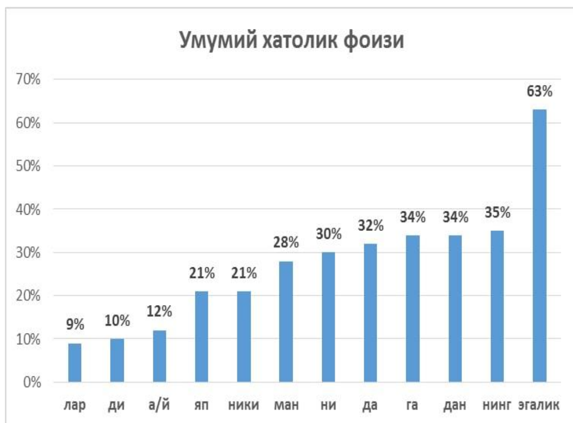
1-чизма. Ҳинд талабалари билан ўтказилган тажриба натижалари (фоиз ҳисобида)

Шу вақт оралиғида талабалар билан ўтказилган онлайн дарслар биз томондан кузатилди. Қўшимчалар тартибини аниқлашда синалувчиларнинг уйга вазифалари ҳам инобатга олинди. Тажриба синалувчиларининг сўз таркибида қўшимчадан тўғри ёки нотўғри фойдаланиши, қўшимчанинг туширилиб қолдирилиш ҳолатлари биз томондан белгилаб борилди. Тажриба-кузатув натижалари статистик таҳлил қилиниб, натижалар умумлаштирилди ва 1-, 2-чизмада берилди: