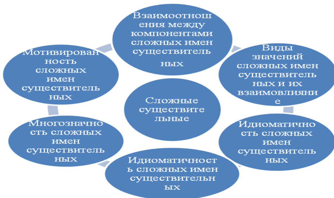
Рисунок 1. Принципы семантического анализа сложных существительных

Каждый из этих элементов формирует основные проблемы в семантике сложных существительных. Все эти элементы взаимосвязаны между собой и изображение их по отдельности будет иметь определенную условность.