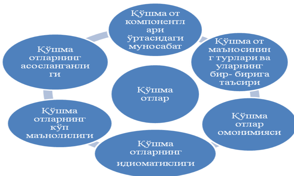
1 - расм. Қўшма отларнинг семантик таҳлилининг тамойиллари

Композиталар маъноси асосан қўшма отларнинг «семантик схема»сини аниқлаб берадиган компонент ўртасидаги муносабатга асосланади (1 - расмга қаранг ):