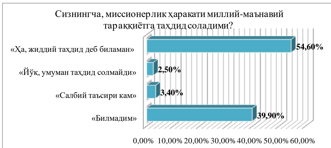
2-расм. Социологик сўровномадан намуна

Ёшларнинг миссионерликдан хабардорлигини, ушбу ҳаракатнинг таҳдидини англашини, оқибатларини баҳолай олишини аниқлаш, шунингдек, ёшларнинг миссионерликка нисбатан муносабатини белгиловчи муҳим мезонлар тўғрисида уларнинг ўз дунёқарашлари нуқтаи назаридан хулосалар қилиш мақсадида социологик сўровнома ўтказилди. Ушбу сўровнома 2020 йил декабрь – 2021 йил февраль ойларида Тошкент шаҳри ва Тошкент вилоятидаги олий таълим муассасалари ва умумтаълим мактабларида ўтказилди. Сўровномада 1018 нафар респондент иштирок этди. Саволларга респондентларнинг жавоблари қуйидагича бўлди: респондентларнинг 49,7%и «Миссионерлар деган тушунчани эшитганмисиз?» деган саволга - «Эшитганман, бу тушунча нимани англаганини тушунаман», 25,8 %и- «Эшитганман, лекин нима эканлигини тушунмайман», 24,5%и эса – «Эшитмаганман», деган жавобни беришди.