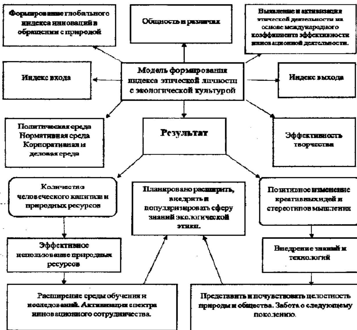
1-рисунок. Модель формирования индекса этической личности с экологической культурой.

В современном мире экологическую и этическую культуру необходимо рассматривать как необходимую часть профессиональной культуры в воспитании подрастающего поколения. Действительно, в этом отношении важно не только развитие взаимосвязи между природной средой и общественной жизнью, скорее всего, формирование процесса культивирования экологической этической культуры и улучшить задачу подготовки педагогических кадров, способных к исследованиям в практической области, основанной на творческой, рациональной деятельности, которая меняет знания об окружающей среде. Следовательно одна из важных задач перед государством и обществом Узбекистана является формирование и развитие экологической этики, реализация функциональной системы устойчивых моделей и механизмов.