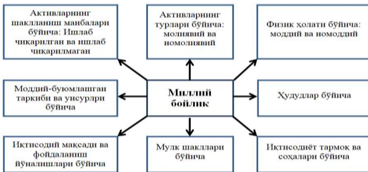
1-расм. Миллий бойлик унсурларининг гуруҳланиши 11

Миллий бойлик категориясини тадқиқ қилишда унинг таркибий қисмларини таснифлаш алоҳида илмий-услубий аҳамиятга эга. Иқтисодчи олимлар миллий бойликнинг таркибий қисмларини гуруҳлаш ва таснифлашда қуйидаги белгиларга эътибор қаратиш лозимлигини таъкидлайди (1-расм).