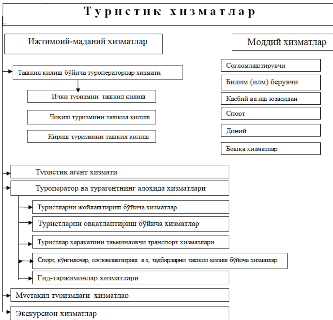
1-расм. Туристтик хизматлар таснифи

Туризм соҳасида кўрсатиладиган хизматлар турларининг таснифлари турлича. Улардан бири 1-расмда ўз аксини топган 15 .