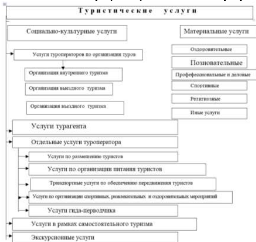
Рис. 1. Классификация туристических услуг.

удовлетворение возникаемых во время путешествия и отдыха за пределами места проживания или внутри своей страны экономических, культурных, социальных потребностей людей посредством предоставления им услуг в различных сферах и секторах экономики, одна из основных составляющих, то есть неотъемлемая часть индустрии, производящей эти услуги и товары.