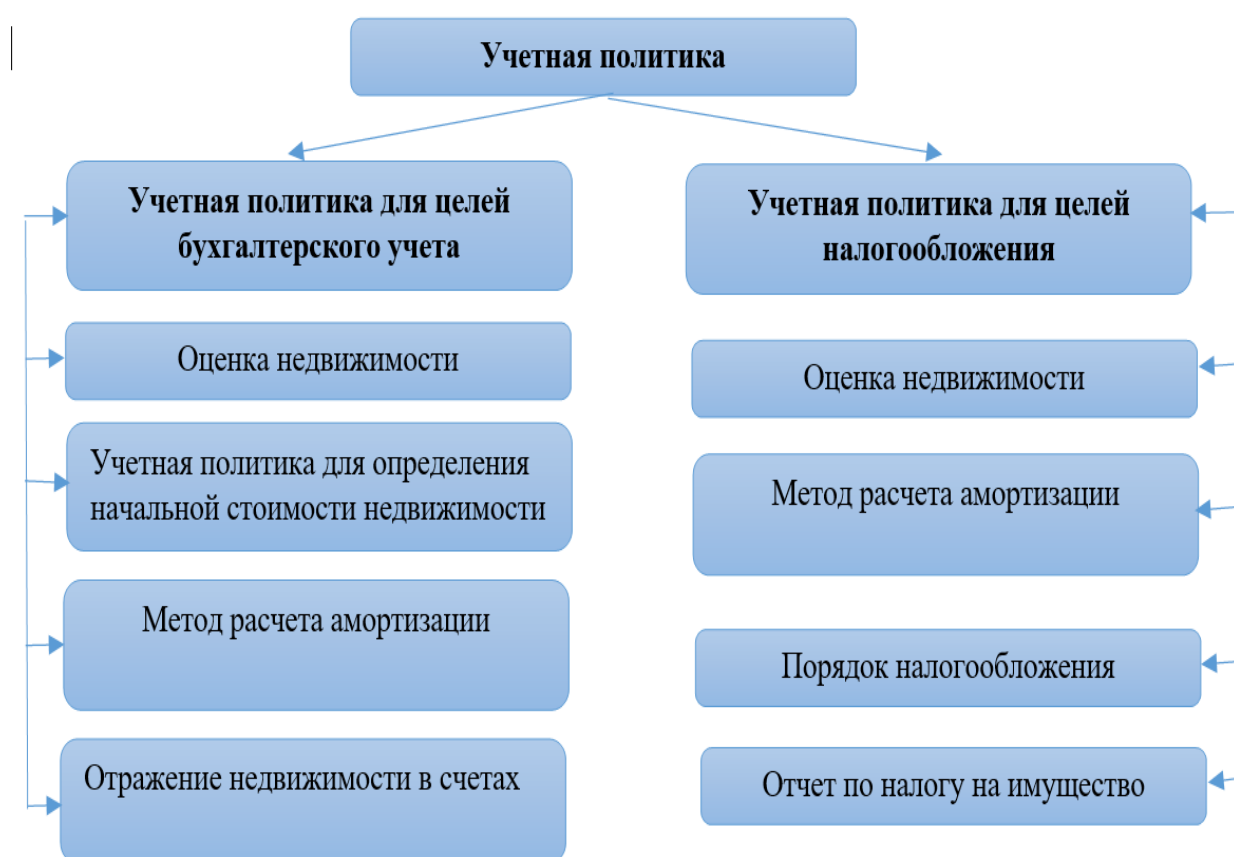
Рисунок 2. Модель отражения недвижимости в учетной политике хозяйствующего субъекта 18

Это обеспечивает правильную организацию учета недвижимости и полноту налогообложения. Мы разработали модель отражения недвижимости в учетной политике хозяйствующего субъекта (рисунок 2).