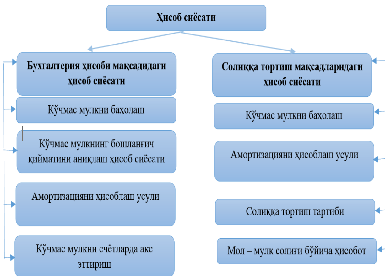
2-расм. Хўжалик юритувчи субъектнинг ҳисоб сиёсатида кўчмас мулкни акс эттириш модели 18

Муаллиф томонидан хўжалик юритувчи субъектнинг ҳисоб сиёсатида кўчмас мулкни акс эттириш модели ишлаб чиқилди (2-расм).