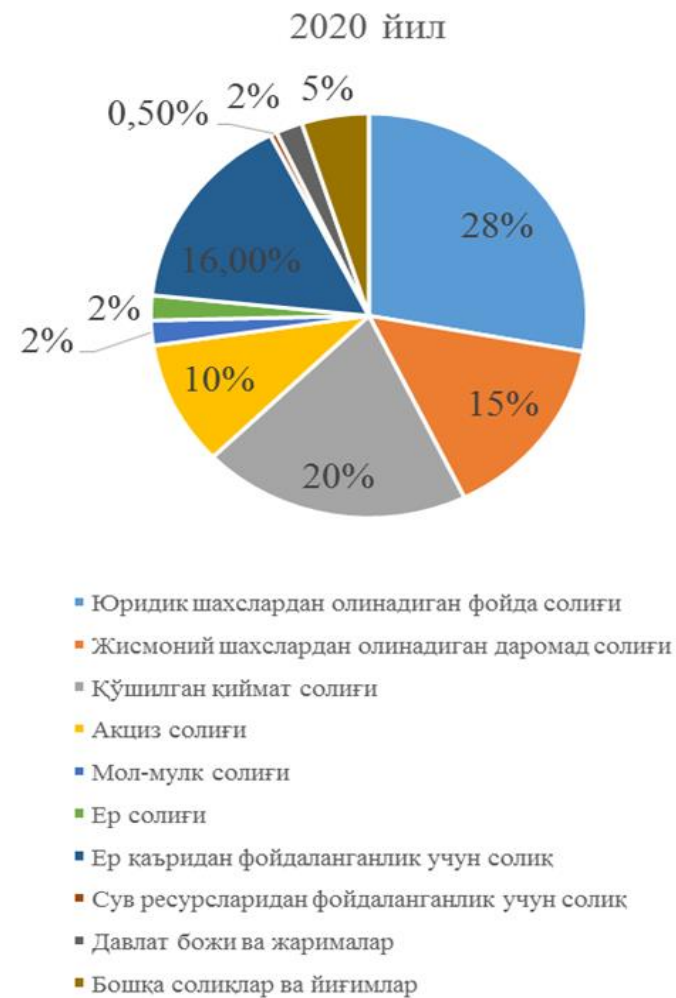
1-расм. Ўзбекистон Республикасининг 2019-2020 йилларда давлат бюджети даромад қисмининг шаклланишида солиқ турларининг улуши 16 .