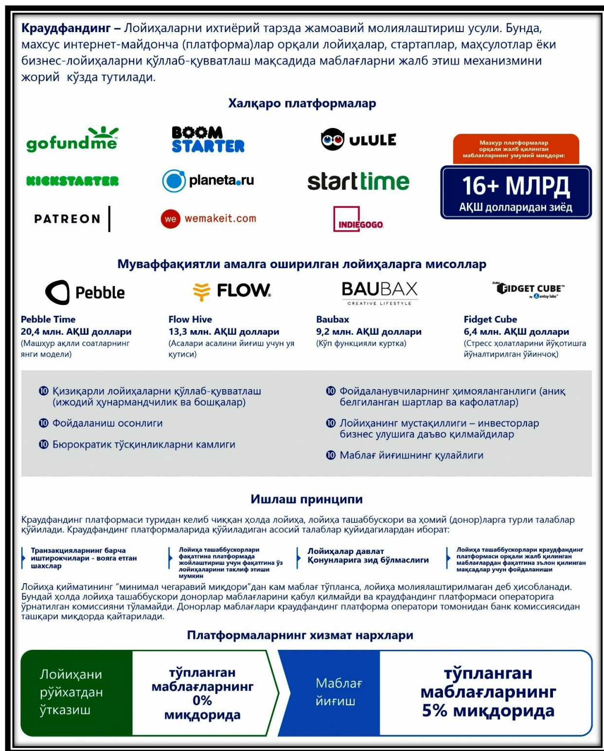
1-расм. Краудфандинг платформасини ишлаш принципи 13

Хусусан, ахборот технологиялари соҳасидаги лойиҳаларни краудфандинг платформаси орқали жойлаштириш ва молиялаштириш механизми. Ушбу схема ёш тадбиркорлар ва стартапларга инвестицияларни жалб этиш ҳамда молиялаштириш манбаларини топиш имкониятини яратиб беради.