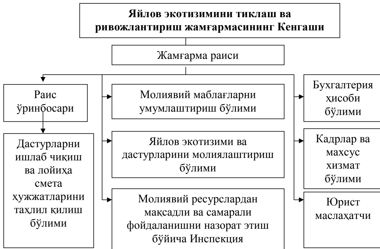
3-расм. Яйлов экотизимини тиклаш ва ривожлантириш жамғармасининг ташкилий тузилмаси 13 (тавсиявий).

Республикамизнинг катта ҳудудини эгаллаган, сурункали курғоқчилик кузатилаётган, чўлланиш ва таназзуллик хавфи юқори бўлган яйловларимизни тиклаш, экотизим ва биохилма-хиллигини сақлаш ҳамда ривожлантириш каби йирик тадбирларни ишлаб чиқиш ва самарали молиялаштириш механизмини амалга ошириш мақсадида Ўзбекистон Республикаси Ипакчилик ва жун саноатини ривожлантириш кўмитаси ҳузурида «Яйлов экотизимини тиклаш ва ривожлантириш жамғармаси»ни ташкил қилиниши илмий жиҳатдан асосланди ва бу жамғарманинг ташкилий тузилмаси лойиҳаси ишлаб чиқилди (3-расм).