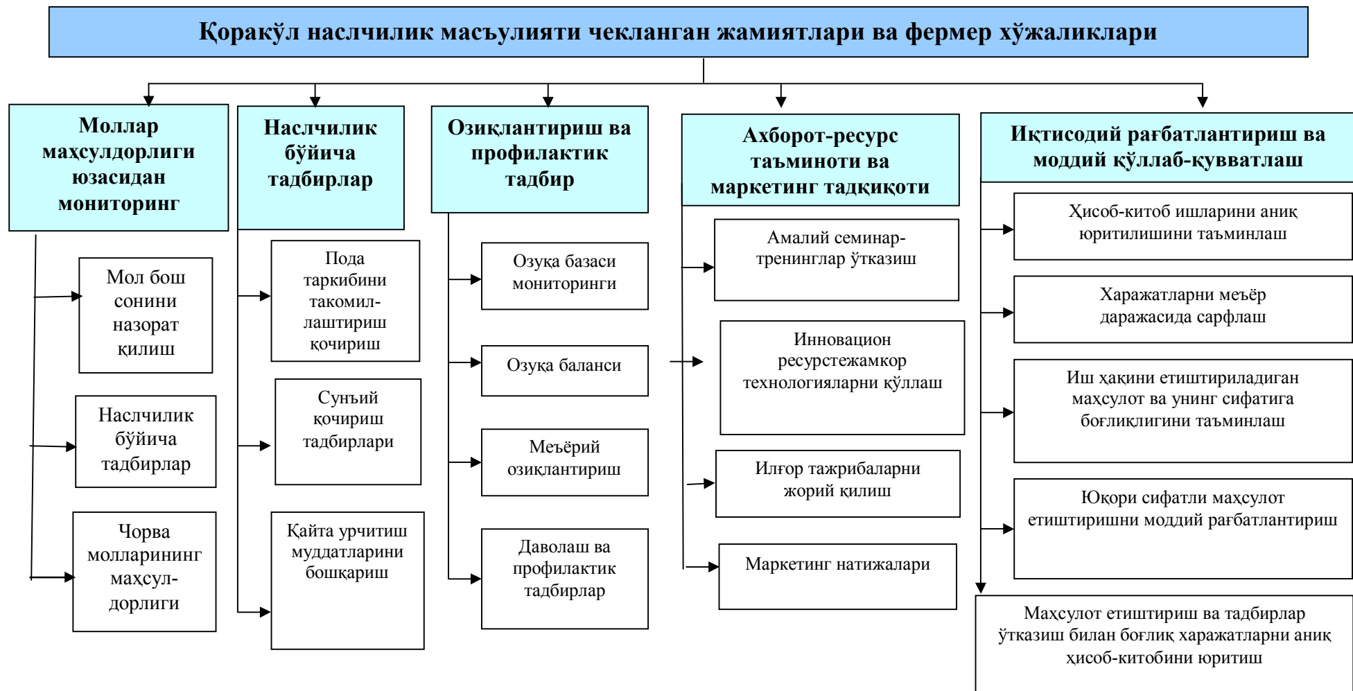
2-расм. Қорақўлчилик хўжаликларида «Чорвачилик тармоғини самарали бошқаришнинг уйғунлашган тамойиллари» 12