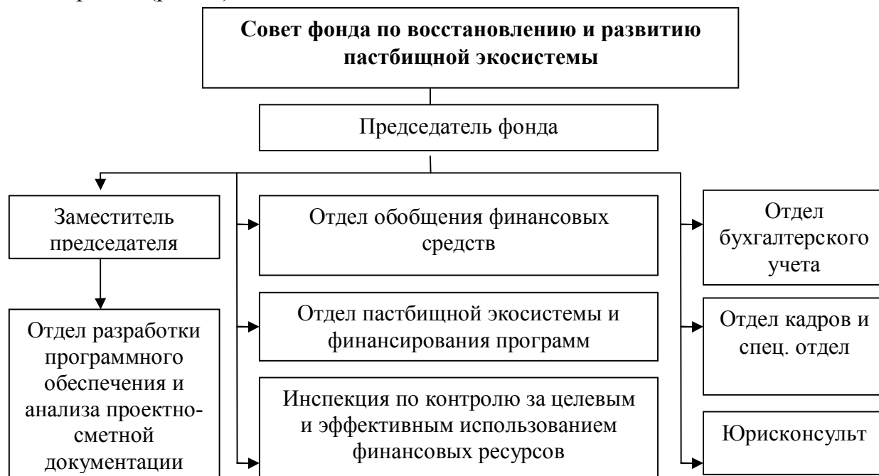
Рис. 3. Организационная структура Фонда восстановления и развития пастбищной экосистемы 13 (рекомендуемая).

С целью разработки масштабных мер, таких как восстановление пастбищ, которые занимают большую территорию нашей республики, испытывающие хроническую засуху, высокий риск опустынивания и деградации, сохранения и развития экосистем и биоразнообразия, а также задействования эффективного механизма финансирования, научно обосновано создание «Фонда восстановления и развития пастбищной экосистемы» при Комитете по развитию шелководства и шерстяной промышленности Республики Узбекистан и разработан проект организационной структуры этого фонда (рис. 3).