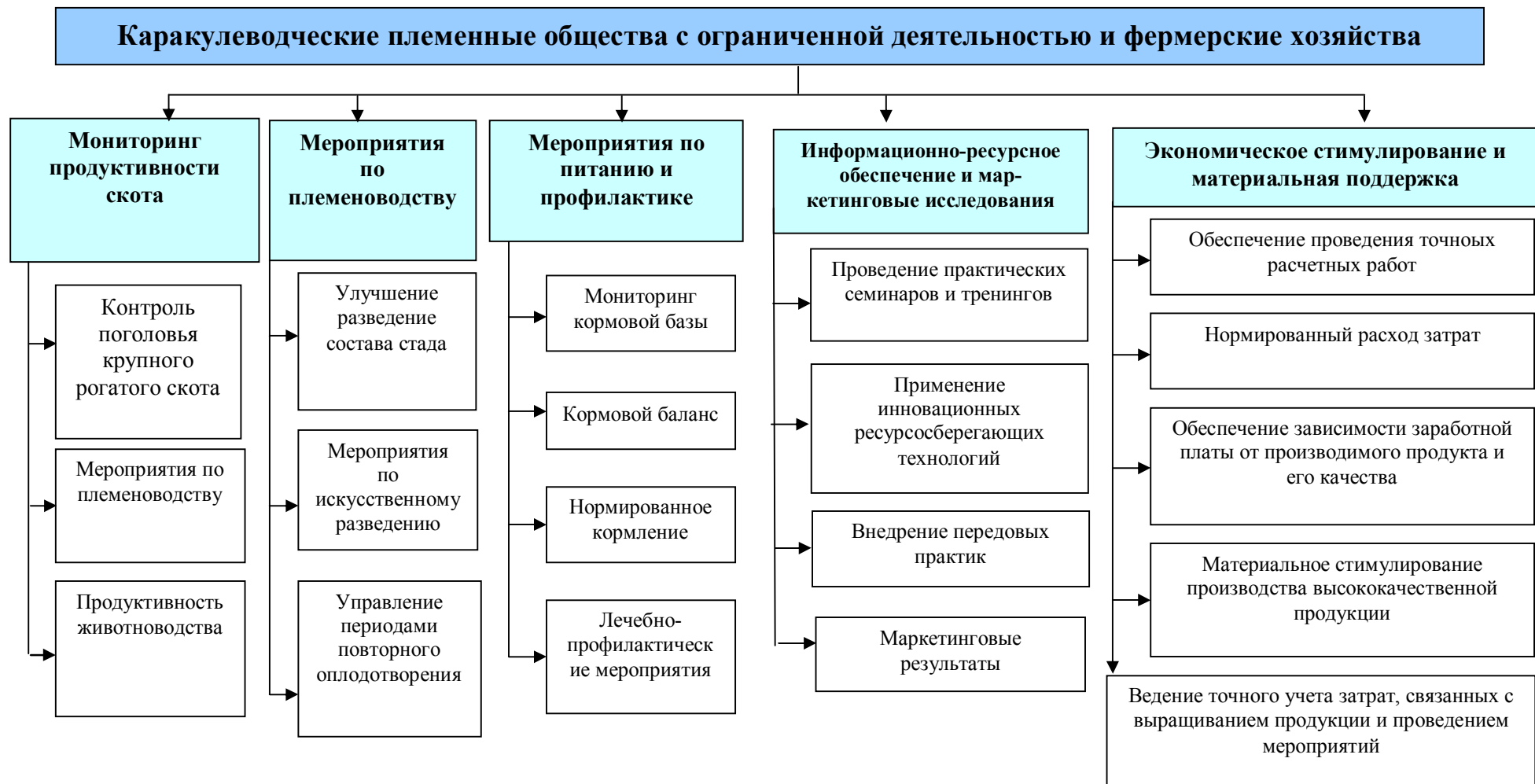
Рис. 2. «Согласованные принципы эффективного управления животноводческой отраслью» в каракулеводческих хозяйствах 12