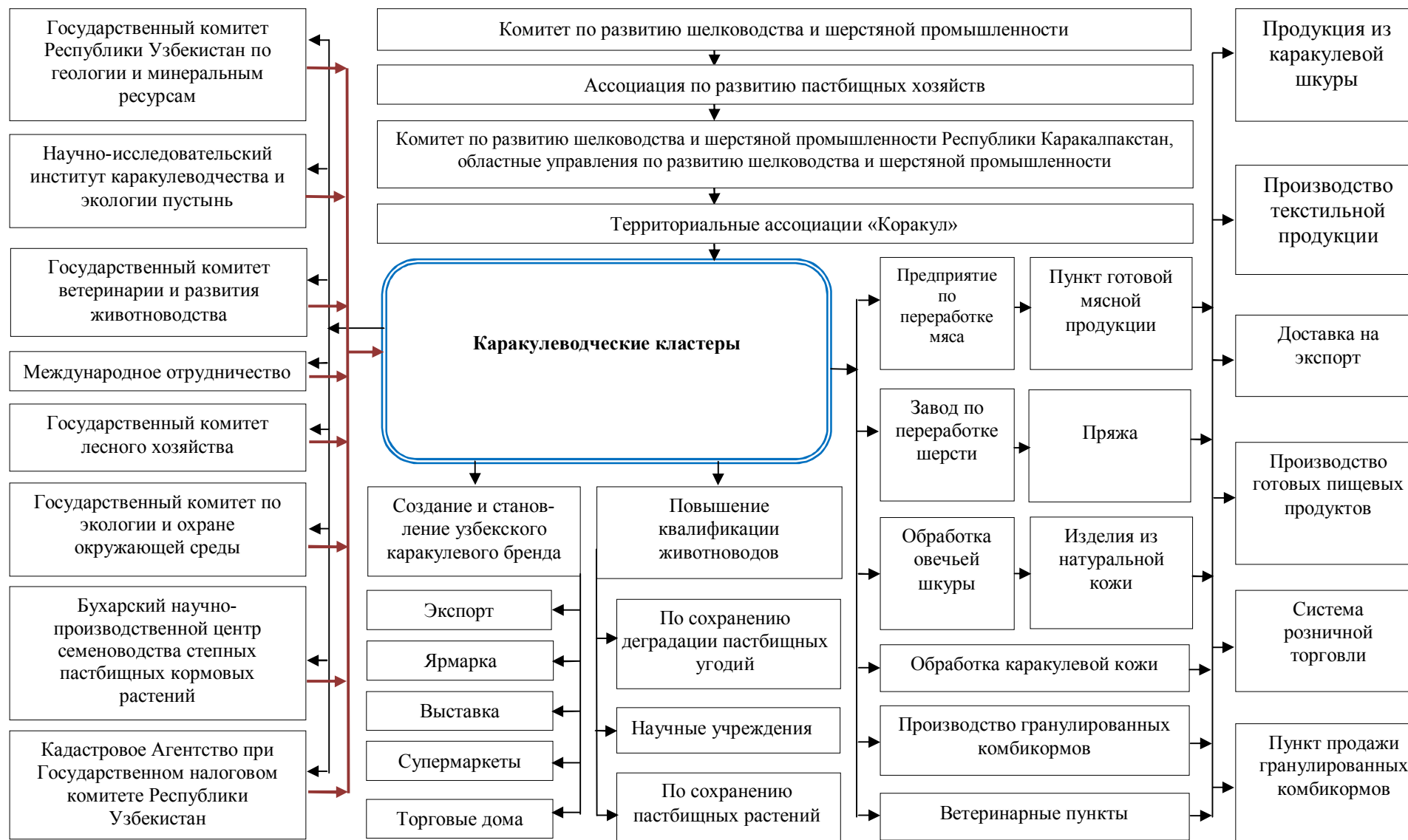
Рис. 4. Типовая организационная структура каракулеводческого кластера 15