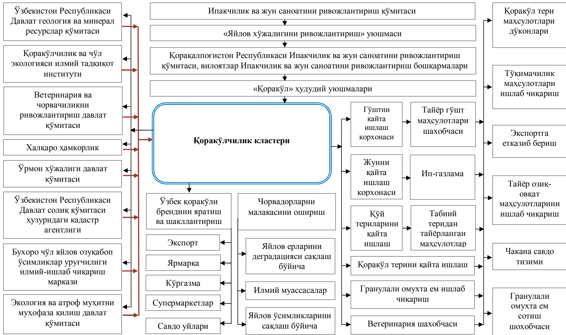
4-расм. Қоракўлчилик кластерининг намунавий ташкилий тузилмаси 15