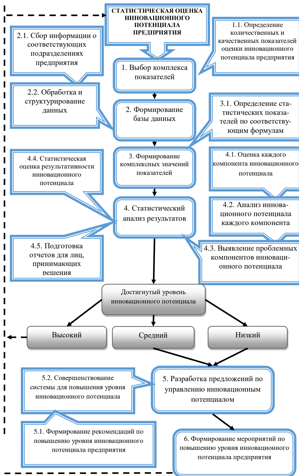
Рис.2. Система статистической оценки инновационного потенциала предприятия методом структурного анализа 10

Количество промышленных предприятий – X_4=16,2+1,8*t ;