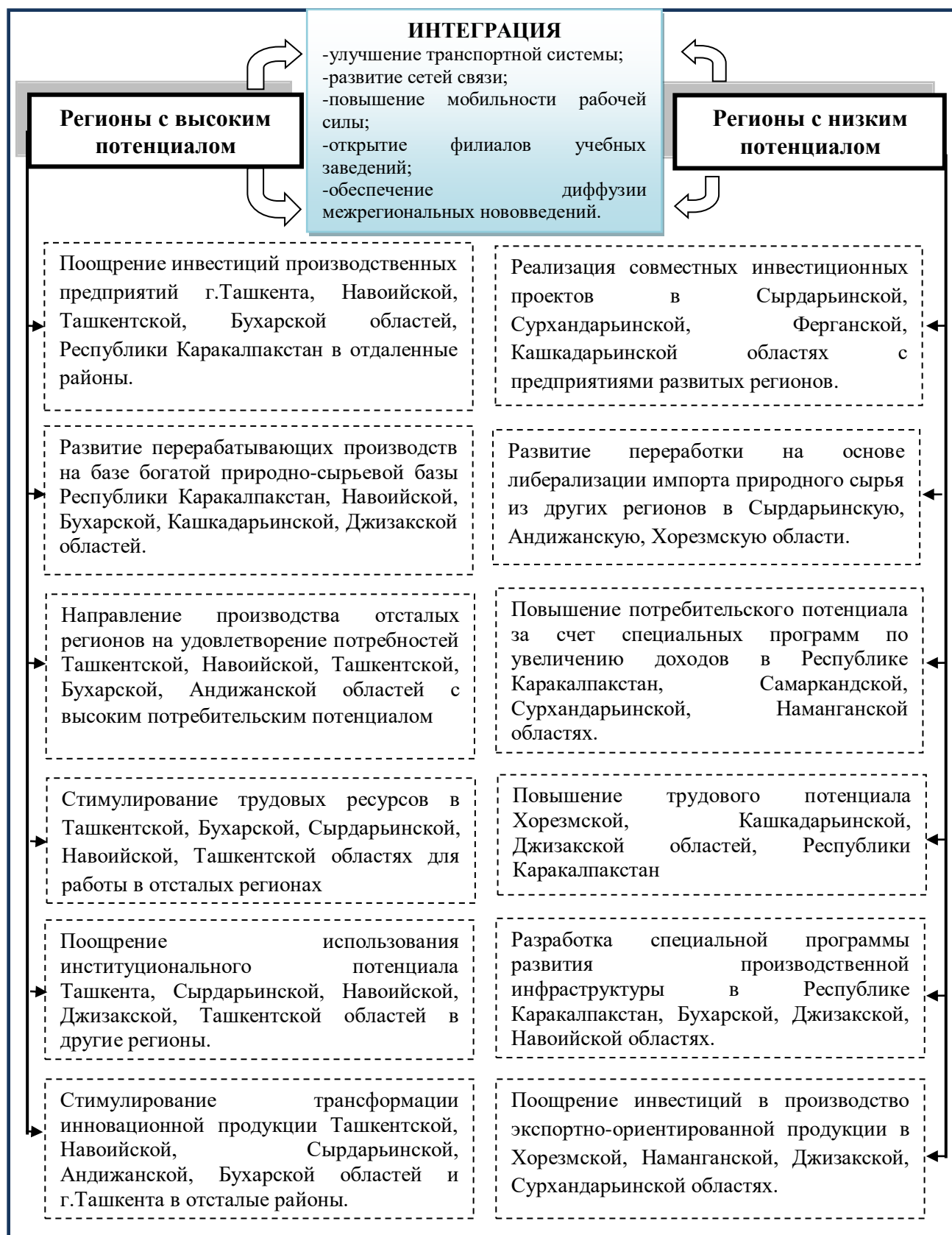
Рисунок 1. Механизм обеспечения интеграции центров роста и относительно отсталых регионов Узбекистана 14