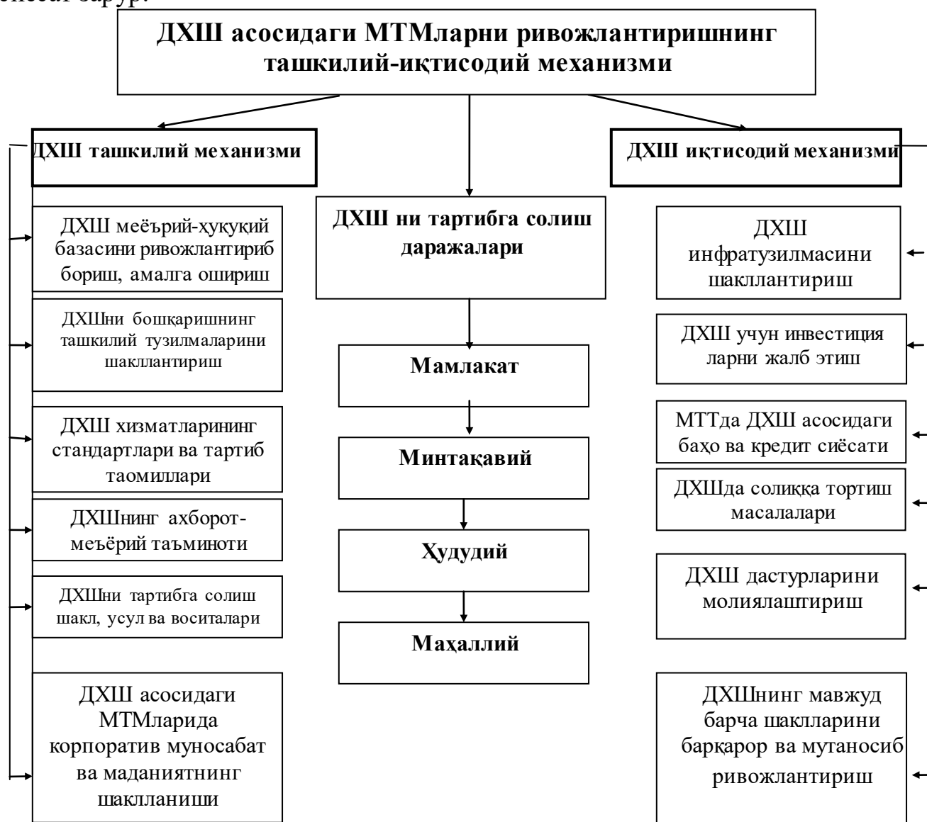
1-расм. ДХШ асосидаги МТМларни ривожлантиришнинг ташкилий-иқтисодий механизми

биноларни таъмирлаш ва реконструкция қилиш, инновацион компаниялар ва бошқалар билан боғлиқ бўлган хизматлар турлари киради. Шунингдек, бизнинг таҳлилларимизга кўра, ҳудудлар иқтисодиётидаги "ўсиш секторлари ва нуқталари", айниқса, хизматлар соҳасини ривожлантириш салоҳияти, янги механизмлари тўлақонли ўрганилмаган ва иқтисодий-статистик жиҳатдан етарлича баҳоланмаган. Шу сабабли, бизнинг фикримизча, ҳудудларда хизмат кўрсатиш соҳаси, хусусан МТТни самарали ривожлантириш учун чет элларда ва республикада кўпгина соҳаларда кенг қўлланилаётган давлат-хусусий шерикчилик (ДХШ) механизмини ривожлантириш бўйича аниқ сиёсат зарур.