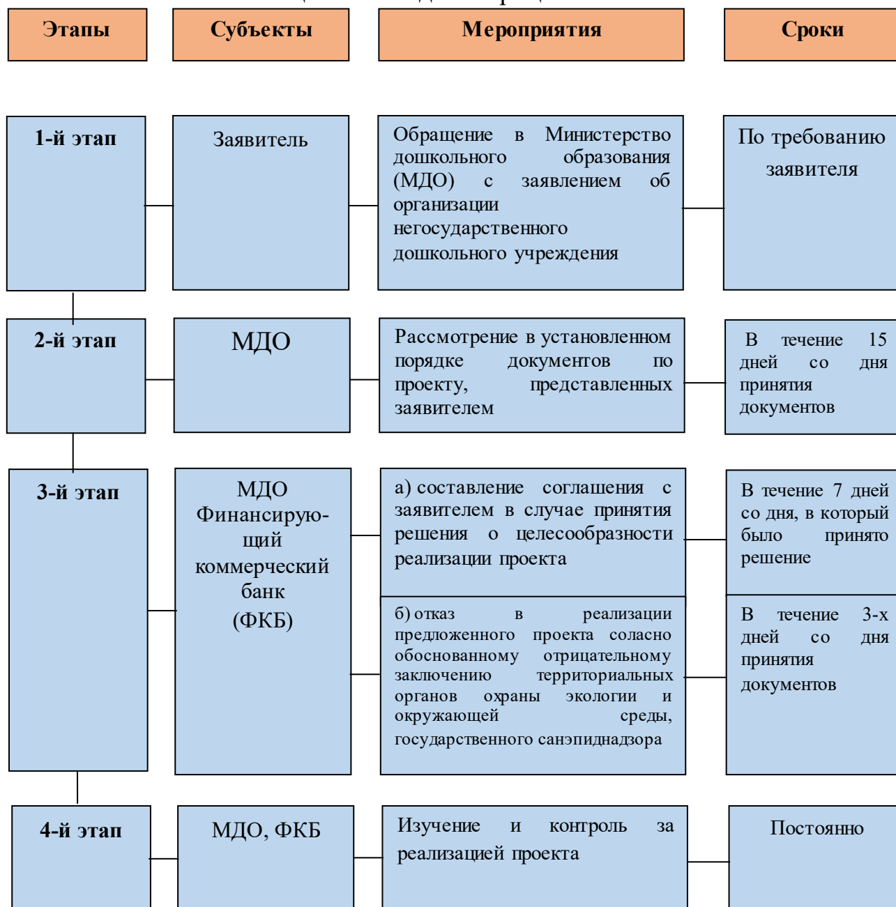
Рис. 2. Усовершенствованный порядок организации на основе ГЧП негосударственных форм ДОО на землях, зданиях и сооружениях, относящихся частному партнеру 72

материально-технической базы, благоустройству территорий, обеспечения соблюдения санитарно-гигиенических требований; инфраструктура и состояние материально-технической базы ДОО не полностью соответствует требованиям времени, а также рост численности населения страны не позволяют обеспечить охвата детей дошкольным образованием на необходимом уровне. Поэтому правительством республики, лично Президентом поставлены приоритетные задачи в период до 2030 года повышения уровня охвата детей ДОО до 80 процентов, доли ДОО, основанных на ГЧП в общем охвате до 75 процентов.