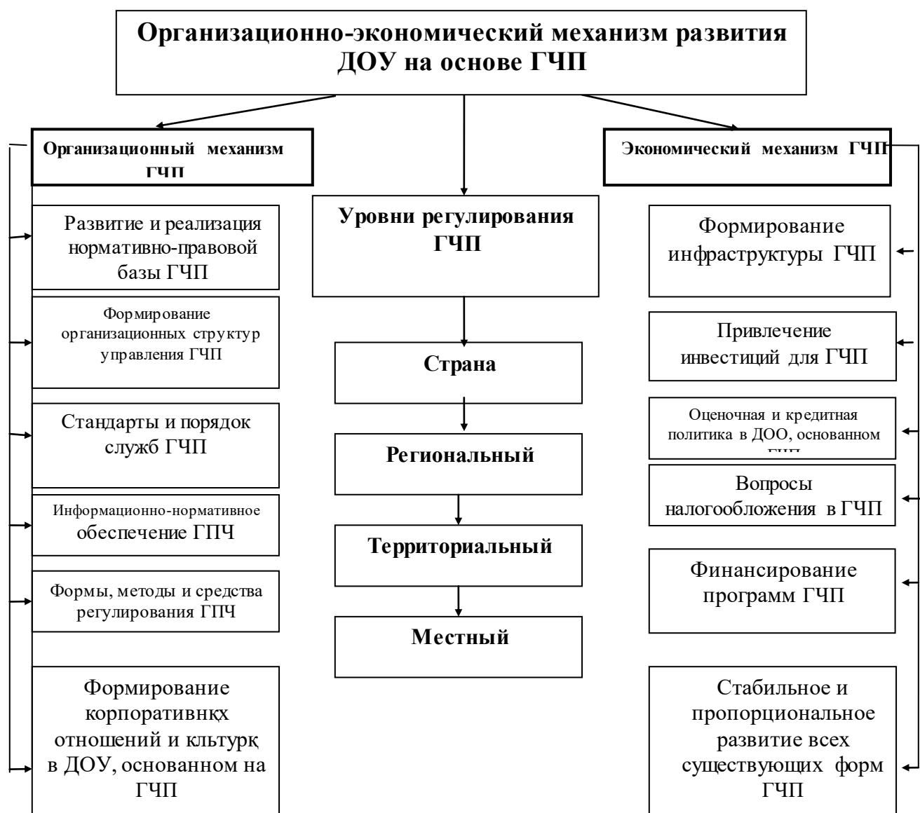
Рис. 1. Организационно-экономический механизм развития ДОУ, основанных на ГЧП

Согласно нашим исследованиям, наблюдается повышение роли оказания услуг в формировании экономики, их сближение и органическое сочетание с отраслями промышленности. В частности, к ним относятся виды услуг, связанные с инвестиционными фондами и деятельностью компаний, риэлторской службой ( поиск, нахождение, продажа, реклама недвижимости ), маркетингом ( размещение услуг, реклама, продажа, страхование и пр. ), менеджментскими услугами ( надежное управление, внешнее управление и пр. ), гостиничным и ресторанным бизнесом ( размещение, встреча и проводы, сувениры, питание и пр. более 100 видов ), ремонтом и реконструкцией зданий, инновационными компаниями и другие. Вместе с тем, согласно нашему анализу, недостаточно изучены и оценены в экономико-статистическом аспекте "секторы и точки роста" в экономике территорий, особенно, потенциал развития сферы услуг, их новые механизмы. Поэтому, по нашему мнению, необходима конкретная политика по развитию широко используемого зарубежом и в нашей республике