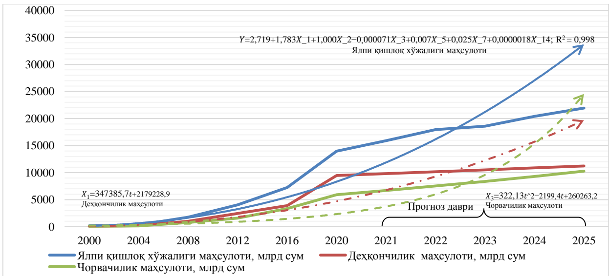
2-расм. Тоғ ва тоғолди ҳудудларида қишлоқ хўжалиги маҳсулотлари етиштиришнинг динамик ривожланиш модели ва истиқболлари 8 .

Таклиф этилаётган модел истиқболда тоғ ва тоғолди ҳудудларида қишлоқ хўжалигини ривожлантириш йўналишларини асослаш, ҳудуд аҳолисини озиқ-овқат маҳсулотлари билан таъминлаш ва соҳанинг барқарор ривожланишини таъминловчи параметрларини ишлаб чиқиш учун услубий ёндашув бўлиб хизмат қилиши мумкин.