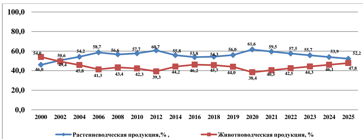
Рисунок 1. Текущее состояние и перспективные параметры производства сельскохозяйственной продукции в горных и предгорных зонах, 2000-2025 гг., в процентах к общему объему 16

Согласно полученным данным, в показателях производства сельскохозяйственной продукции в горных и предгорных зонах наблюдаются тенденции роста, а среднегодовые темпы роста в прогнозируемые годы ожидаются в пределах 5,0-6,5 процентов (рис. 1).