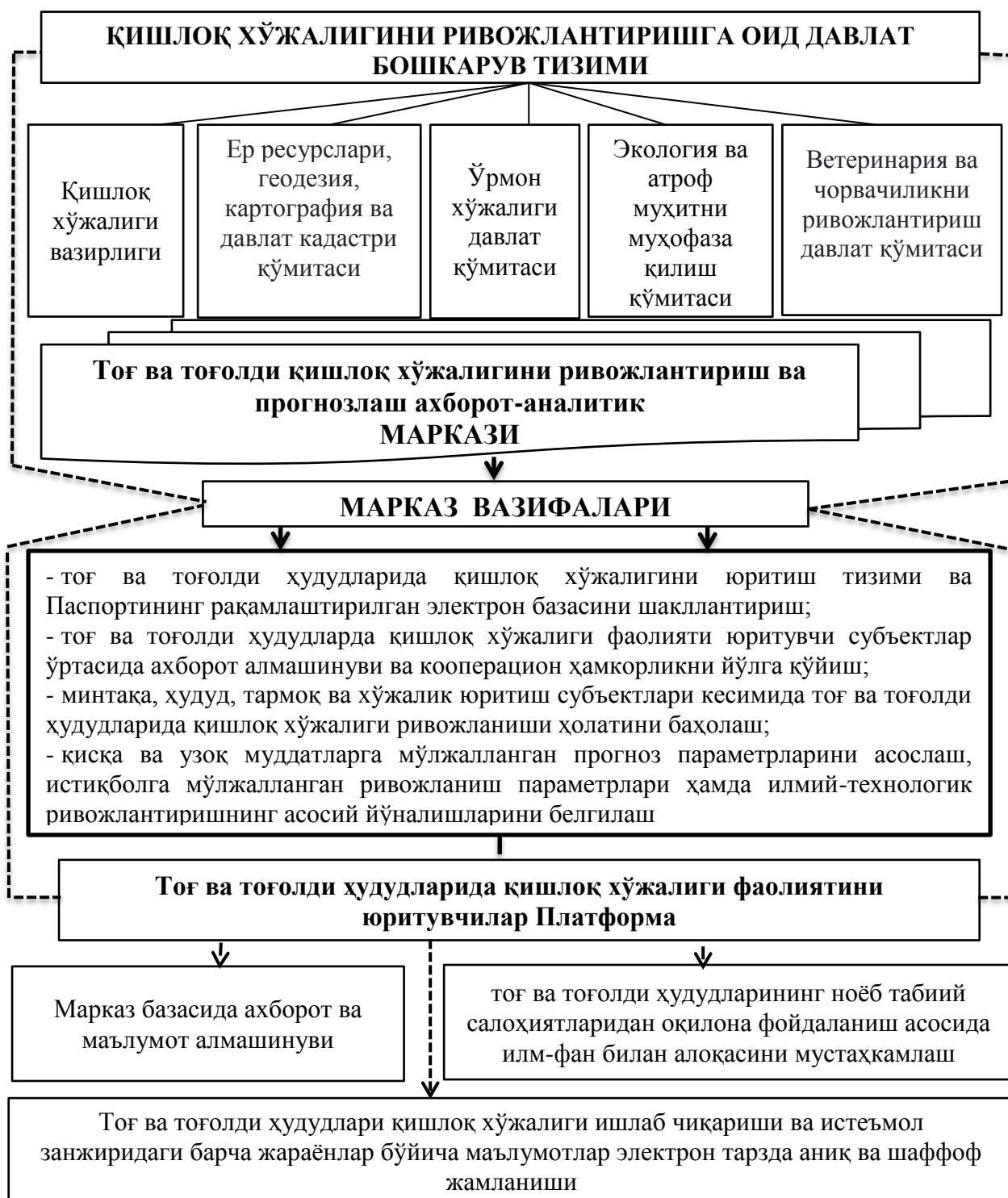
3- расм. Тоғ ва тоғолди қишлоқ хўжалигини ривожлантириш ва прогнозлаш ахборот-аналитик Маркази чизмаси 9

Ушбу марказларда тоғ ва тоғолди ҳудудлари бўйича қишлоқ хўжалиги ишлаб чиқариш фаолияти билан шуғулланувчи барча ишлаб чиқариш субъектлари ишлаб чиқариш ва иқтисодий-молиявий ҳолати, салоҳияти, ишлаб чиқариш самарадорлиги, табиий-иқлим хусусиятлари, ер майдонининг хусусиятлари, рельефи, конфигурацияси, унумдорлиги, балл бонитети,