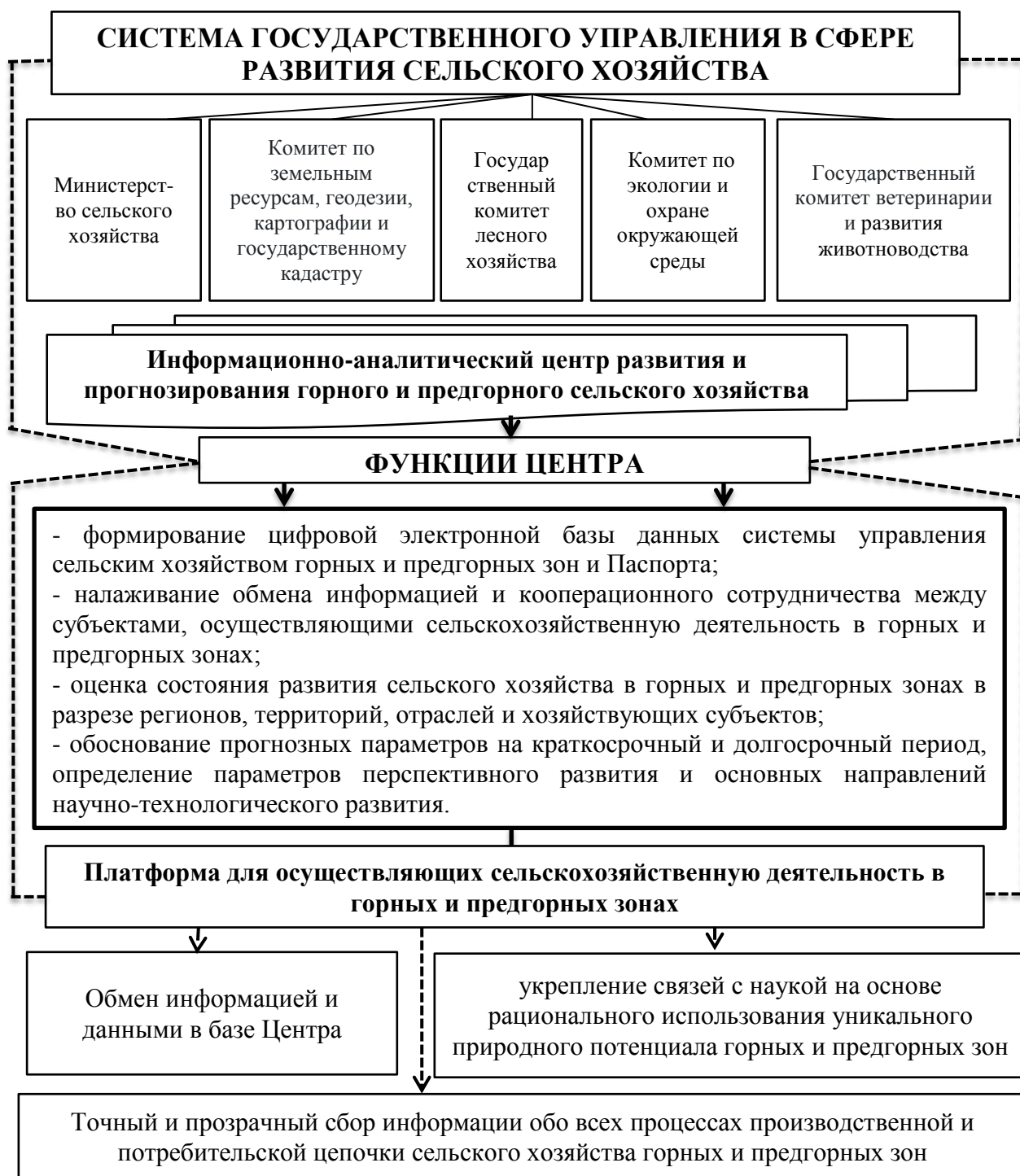
Рисунок 3. Схема Информационно-аналитического центра развития и прогнозирования горного и предгорного сельского хозяйства 18

В этих центрах будет сформирована информационно-справочная база, состоящая из таких данных, как производственное и финансово-экономическое состояние, потенциал, эффективность производства всех субъектов, осуществляющих сельскохозяйственную производственную деятельность в горных и предгорных зонах, природно-климатические характеристики, особенности, рельеф, конфигурация, плодородие, балл бонитет земельных площадей, их обеспеченность минеральными удобрениями, уровень обеспеченности водными ресурсами, производственная структура хозяйств и урожайность посевов, состав и