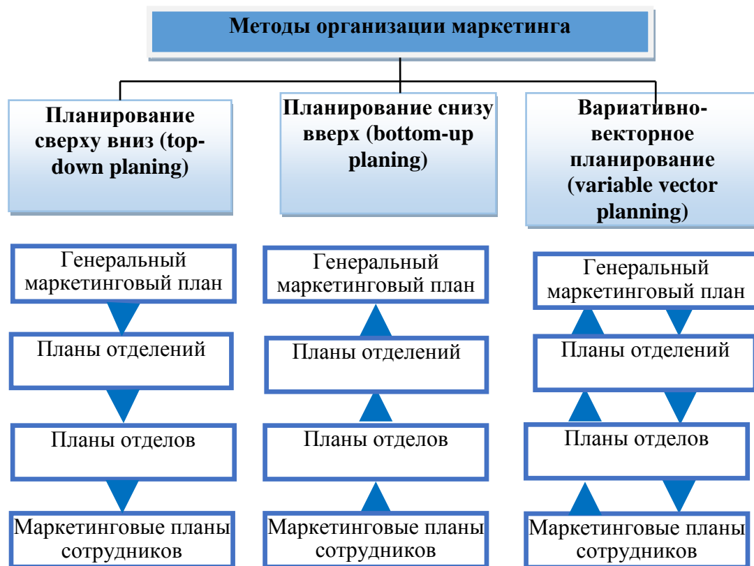
Рис. 1. Методы маркетингового планирования как важнейшая функция управления предприятием 9

функции маркетингового менеджмента, А.Солиев и др. проводили собственные исследования по развитию теории маркетинга. Так, российские ученые А.В. Турьянский и В.Л. Аничин рассматривали агросектор как комплекс, разделенный на три сферы: 1) организации, оказывающие услуги сельскому хозяйству; 2) производители сельскохозяйственных товаров; 3) организации, занимающиеся производством, хранением, переработкой и реализацией сельскохозяйственной продукции 6 , другая группа ученых М.Л. Лезина, В.А. Тихонова и Ю.В. Седых утверждают, что: “Агросектор – это предприятия, обеспечивающие набор средств производства, в том числе агросервисные предприятия, сельскохозяйственные предприятия всех форм собственности и организационно-правовых форм, фермерские и дехканские хозяйства, специализированные семеноводческие и племенные хозяйства, личные подсобные хозяйства населения опытных станций” 7 . По словам К. Бирнбаума, «эффективность и успех аграрного сектора складываются из рабочей силы, капитала, земли и материальных средств. В то же время трудолюбие, предприимчивость и интеллектуальные возможности являются ключом к эффективности сельскохозяйственного сектора» 8 .