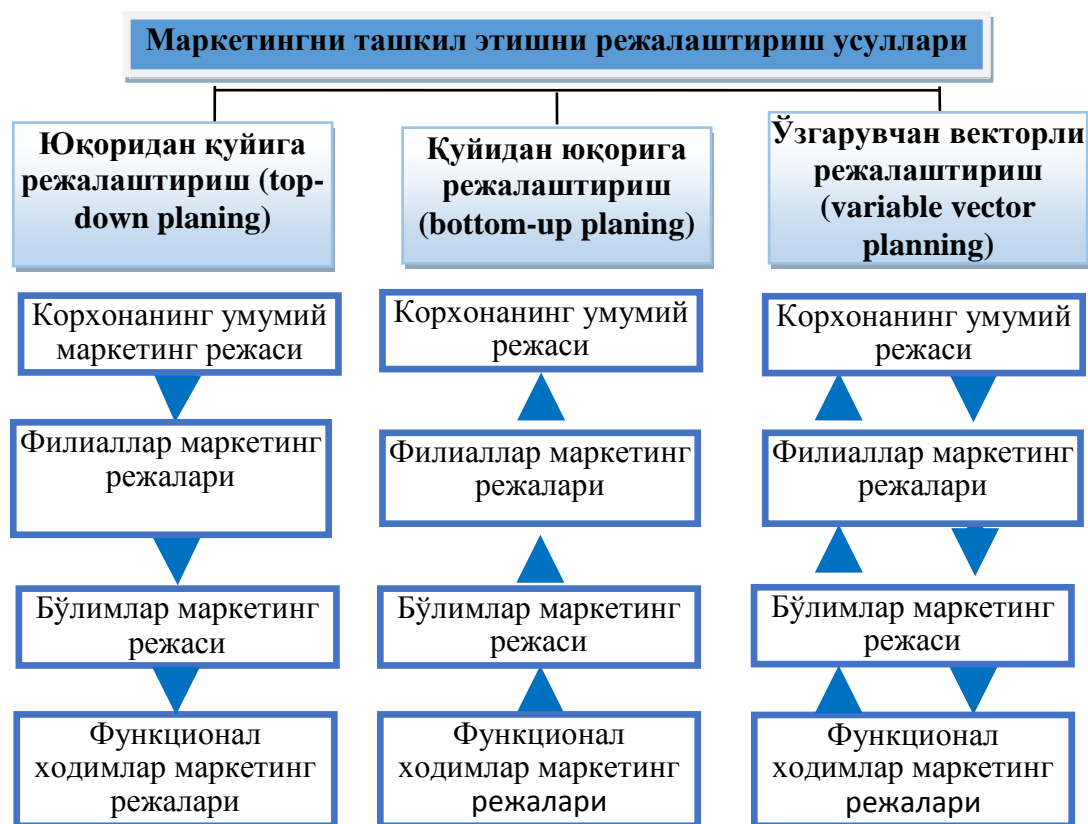
1-расм. Корxonани бошқаришнинг асосий функцияси сифатида маркетингни режалаштириш усуллари 9

Келтирилган таърифлардан келиб чиқиб, маркетингни самарали ташкил этиш фаолият юритувчилар томонидан амалиётда уч хил классификацияга ажратиб ўрганилиши ва жорий этилиши мумкин (1-расм).