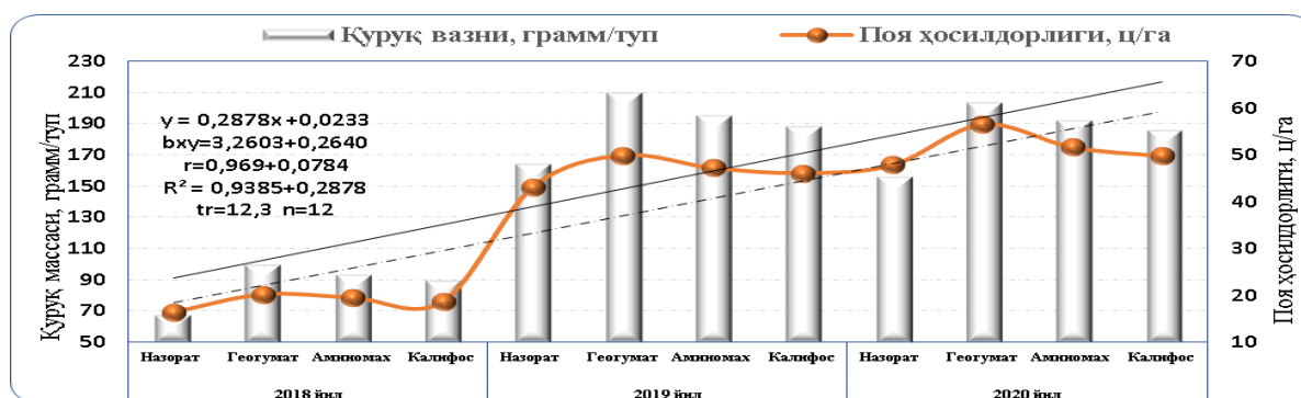
1-расм. Стимуляторлар таъсирида ширинмиянинг ривожланиш даврида куруқ модда тўплаши ва пичан ҳосилдорлиги орасидаги корреляцион боғланиш, (2018-2020 йй).

Жами пичан ҳосили назорат вариантида 107,3 ц/га геогумат стимулятор таъсирида назорат вариантга нисбатан 19,3 ц/га қўшимча ҳосил олинган, аминомакс таъсирида 11,0 ц/га ва калифос биоўғити таъсирида 7,2 ц/га қўшимча ҳосил олинган бўлиб, ушбу биоўғит эвазига ўртача пичан ҳосили 18,0%; 10,2% ва 6,7% га ошган (1-жадвал).