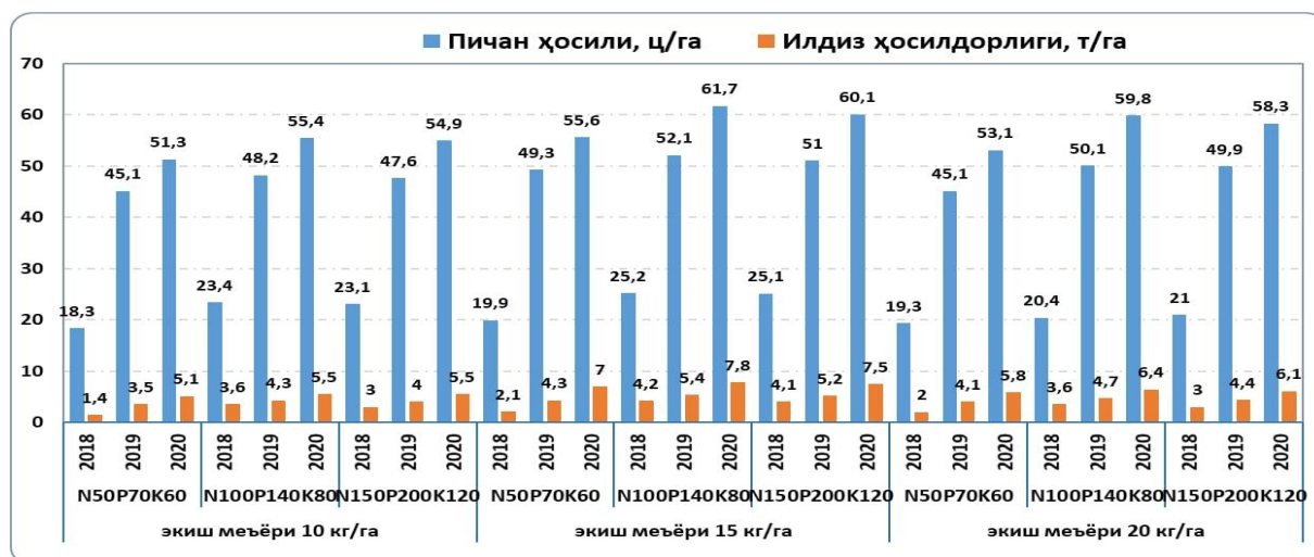
2-расм. Силлик ширинмияни пичан ҳосилига экиш ва ўғитлаш меъёрининг таъсири, ц/га

ҳосилдорлиги гектарига 19,3 центнер, маъдан ўғитлар меъёри N_{100}P_{140}K_{80} кг/га бўлган саккизинчи вариантда пичан ҳосилдорлиги ўртача 20,4 центнерни ташкил этди. Учинчи йилги амал даврида вариантлар бўйича ўзаро мос равишда 51,3-61,7 ц/га пичан ҳосили олинган (2-расм).