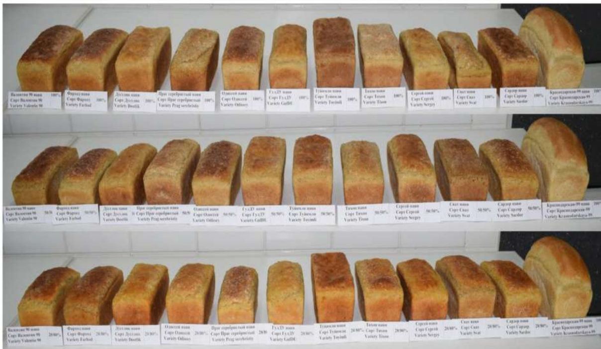
2-расм. Тритикале навларидан ёпилган нонларнинг умумий кўриниши.

Нон ёпишда тритикале ва буғдой уни қоришмаси уч хил нисбатда (100% тритикале уни, 50/50% тритикале-буғдой уни ва 20/80% тритикале-буғдой уни) олинган. Назорат сифатида олинган кузги юмшоқ буғдойнинг Краснодар-99 навидан тайёрланган қолипди нон билан солиштирма таққосланган.