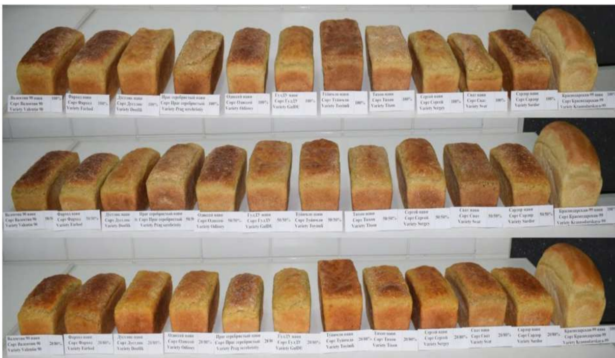
Рис. 1. Общий вид хлеба, приготовленных из сортов тритикале.

При выпечке хлеба тритикале-пшеничная мука была взята в трех соотношениях (100 % мука тритикале, 50/50 % тритикале-пшеничная мука и 20/80 % тритикале-пшеничная мука). Сравнительно сопоставлен с формовым хлебом, приготовленным из сорта мягкой пшеницы Краснодар-99, взятого в качестве контрольного сорта.